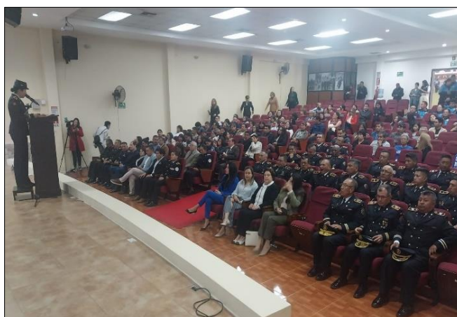
Ilustración 1 Participantes de la Deliberación Pública del CACMQ RdC 2024

El Informe de Rendición de Cuentas del CACMQ se presentó a la ciudadanía en un evento de deliberación pública y evaluación ciudadana realizado a las 10:00 del 9 de julio de 2023 e en las instalaciones del Cuerpo de Agentes de Control Metropolitano de Quito, , con la participación de 159 asistentes de diferentes instancias, autoridades municipales, representantes de unidades educativas, fundaciones, albergues, asambleístas ciudadanos, estudiantes universitarios, estudiantes de colegios y comités barriales.