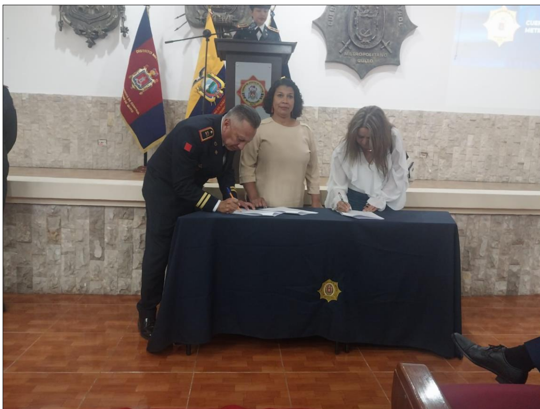
Ilustración 2 Control de Espacio Público y Seguridad Ciudadana